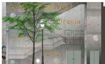
Entwurf © KAWOKA Architekten, Cosmomusivo mosaik