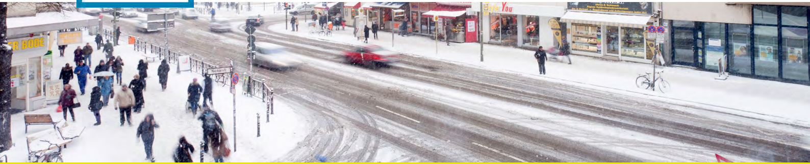
Karl-Marx-Strasse im Winter