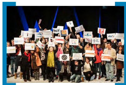
20. Geburtstag Kulturnetzwerk

Die Gründung des Kulturnetzwerk Neukölln e. V. vor 20 Jahren hat maßgeblich dazu beigetragen, der Neuköllner Kulturlandschaft ein neues Gesicht zu geben. Das war am 15. Dezember 2015 ein Grund zum Feiern. Ehrengast in der Neuköllner Oper war die Neuköllner Bezirksbürgermeisterin Frau Dr. Giffey. Mit prominenten Podiumsgästen wurde an die Gründungszeit 1995 erinnert und ein Blick ins Jahr 2035 gewagt. Das Kulturnetzwerk tritt nicht nur als Veranstalter von 48 Stunden Neukölln auf, sondern engagiert sich für neue Zugänge zur Kultur in ganz Berlin. Der Verein ist Teil des BIWAQ-Projekts „Unternehmen Neukölln“ und organisiert mit der „Berlin Mondiale“ berlinweit Kulturprojekte mit Geflüchteten. In den letzten 20 Jahren konnten über das Netzwerk zudem einige hundert Menschen einen neuen Bezug zur Erwerbsarbeit sowie mitunter neue Chancen auf dem ersten Arbeitsmarkt entwickeln. Weitere Informationen: —> www.kulturnetzwerk.de