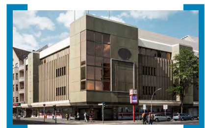
Ehemaliges C&amp;A Gebäude

Im Dezember 2015 wurde das ehemalige C&A-Gebäude an der Karl-Marx-Strasse 95 zur Unterkunft für geflüchtete Menschen hergerichtet. Bis zu 600 Menschen sollen hier vorläufig unterkommen können. Damit es voll belegt werden kann, müssen zunächst die Umbauarbeiten abgeschlossen werden. Das betrifft vor allem die Sanitärbereiche. Im Erdgeschoss soll zudem bald ein offener Cafébereich eingerichtet werden, der Kontakte ermöglicht. Betreiber ist der Malteser Hilfsdienst e.V., der von Sozialarbeitern und Sozialarbeiterinnen sowie