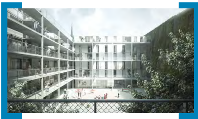
Perspektive Innenhof © EM2N Architekten AG, Zürich